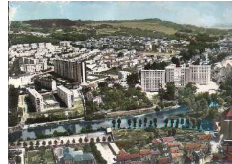
Quartier Saint-Michel Jéricho