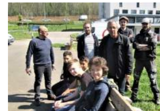
PAGE 2 CENTRE SOCIAL