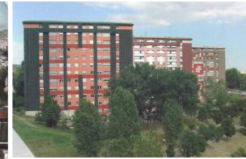
Immeubles Champlain, Cartier et Charcot