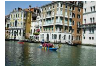
PAGE 2 VIE DE QUARTIER

Journal du Quartier Saint-Michel Jéricho / Grands Moulins - Saint-Max / Malzéville | n°41 | Juillet 2019