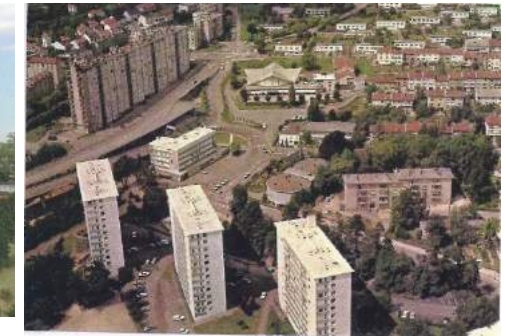
Bâtiments Colomb, Champlain, Cartier, Charcot