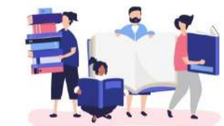
PAGE 4 INFOS & JEU

Cher(e)s ami(e)s Malzévillois et Maxois , Quelles actualités dans le quartier ?